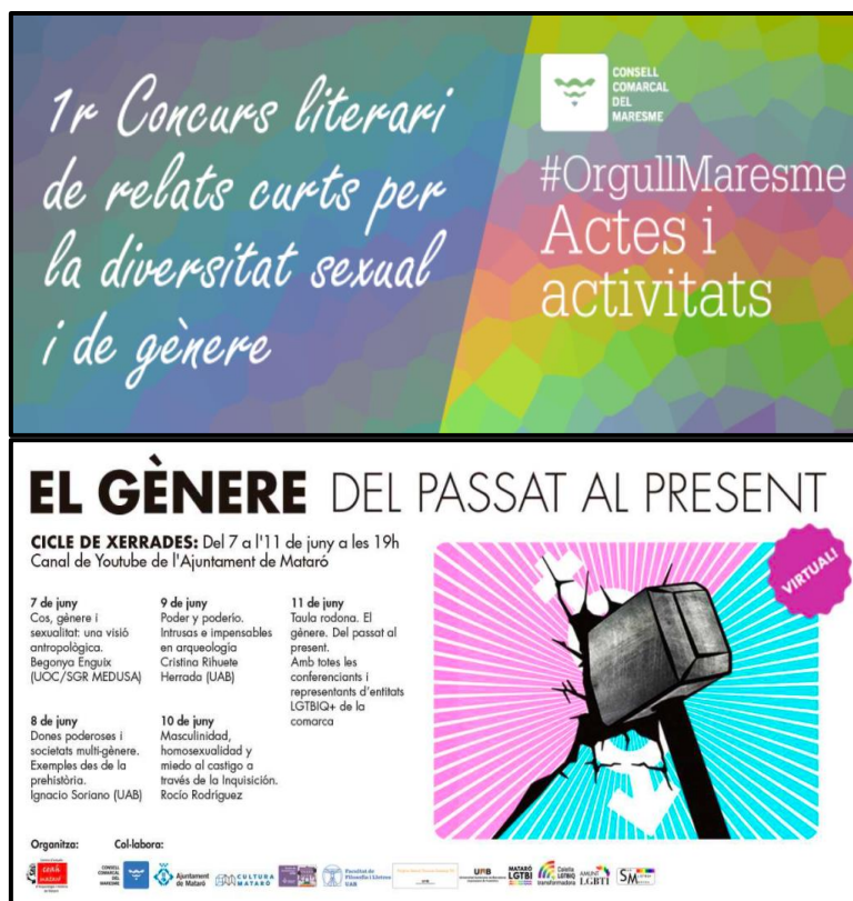
Figura 1: Imatges de les accions realitzades pel Consell Comarcal en relació la diversitat afectiva, sexual i de gènere.