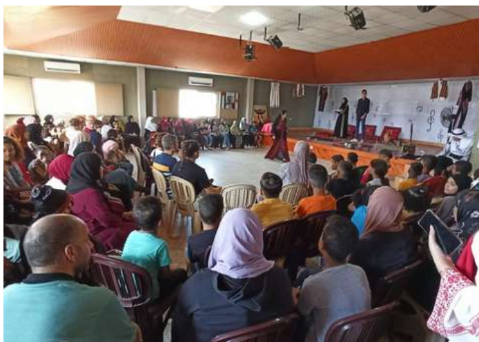
Actuació dels i les joves palestines durant el festival artístic.

Penso que l'impacte que hem aconseguit ha estat donar visibilitat a l'escenari que la comunitat palestina viu i donar veu a la seva lluita i història.