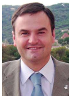
Bernat Graupera i Fàbregas ALCALDE