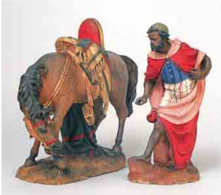
Servent 23.5 x 10.5 x 9