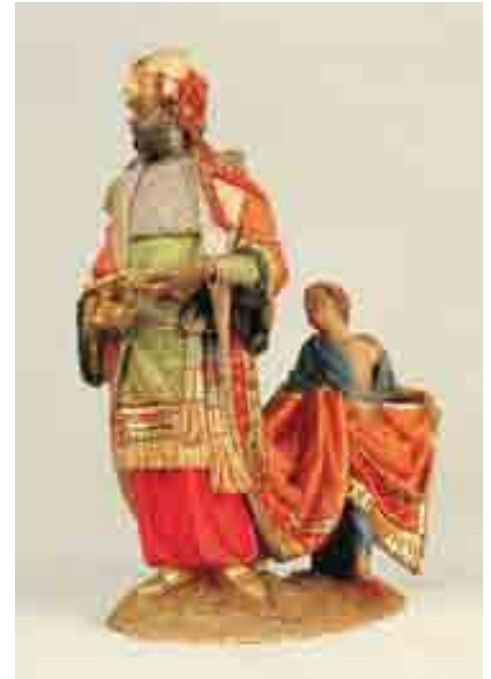
Rei Baltasar amb el seu patge 25.5 x 19 x 10 Museu Etnològic de Barcelona