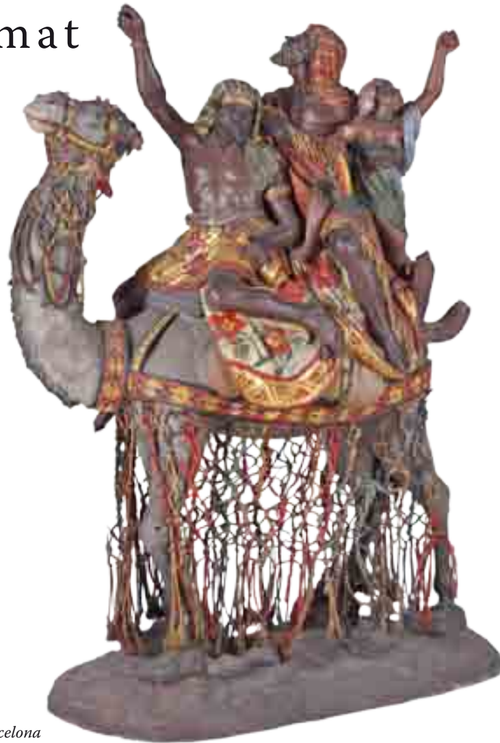
Servents a camell

Del 29 de novembre de 2013 al 19 de gener de 2014