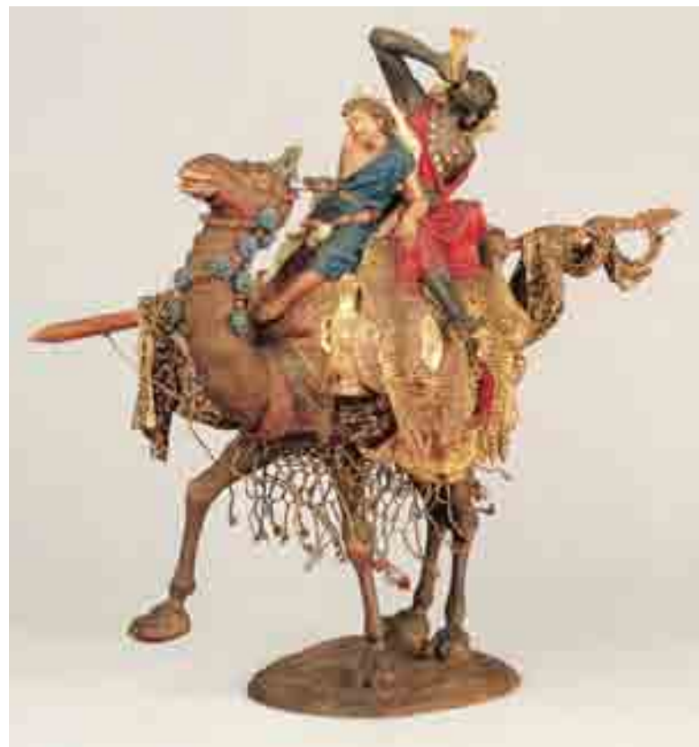
Dos servents a camell