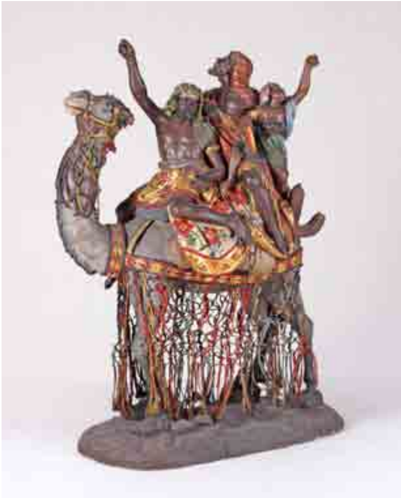
Servents a camell