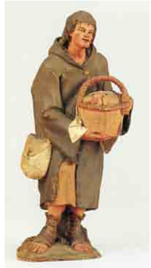
Pagès 22 x 10 x 7 Museu Etnològic de Barcelona