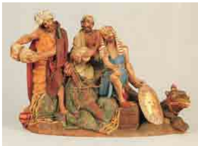
Tres servents amb un camell