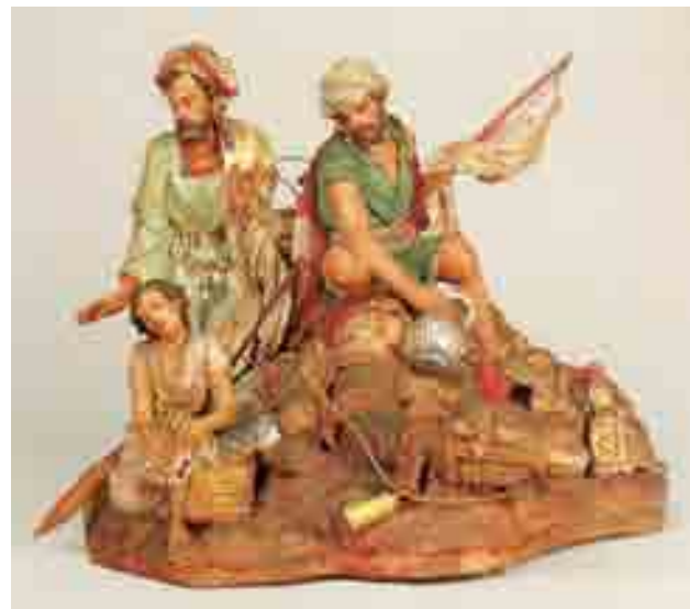
Dos servents i una noia