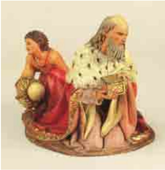
Rei Melchior amb el seu patge 17 x 28 x 17 Museu Etnològic de Barcelona