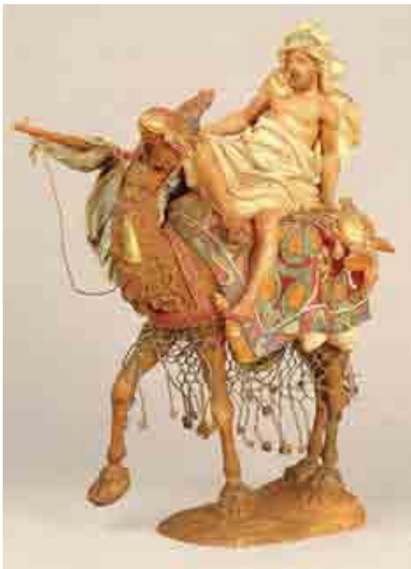
Servent a camell