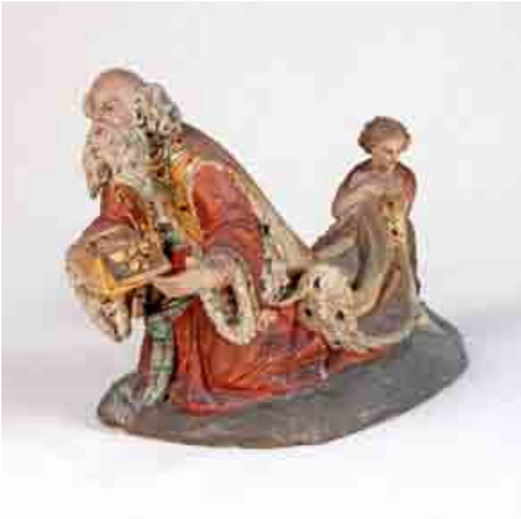
Rei Melcior amb patge