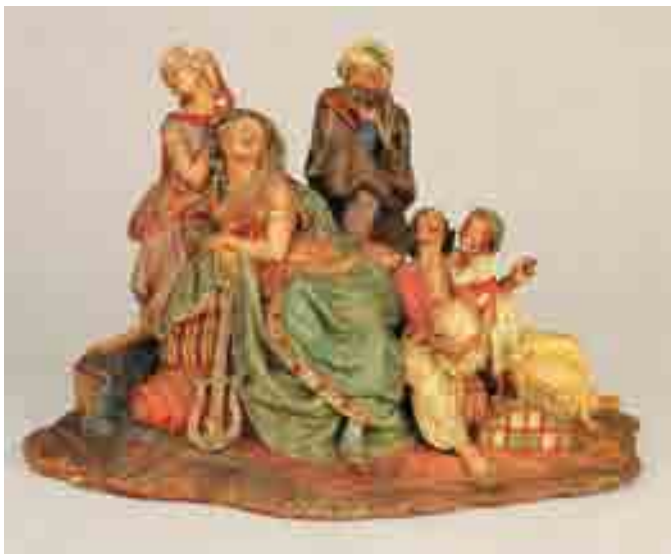
Grup de diversos personatges