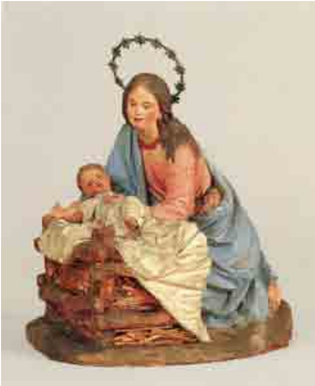
Mare de Déu amb el Nen Jesús