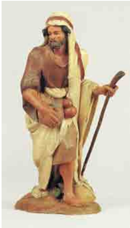
Pastor 22 x 10 x 11.5 Museu Etnològic de Barcelona