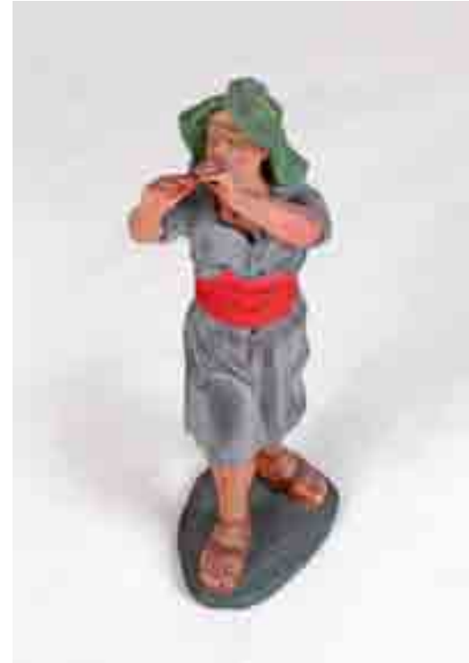
Pastor tocant el flaviol