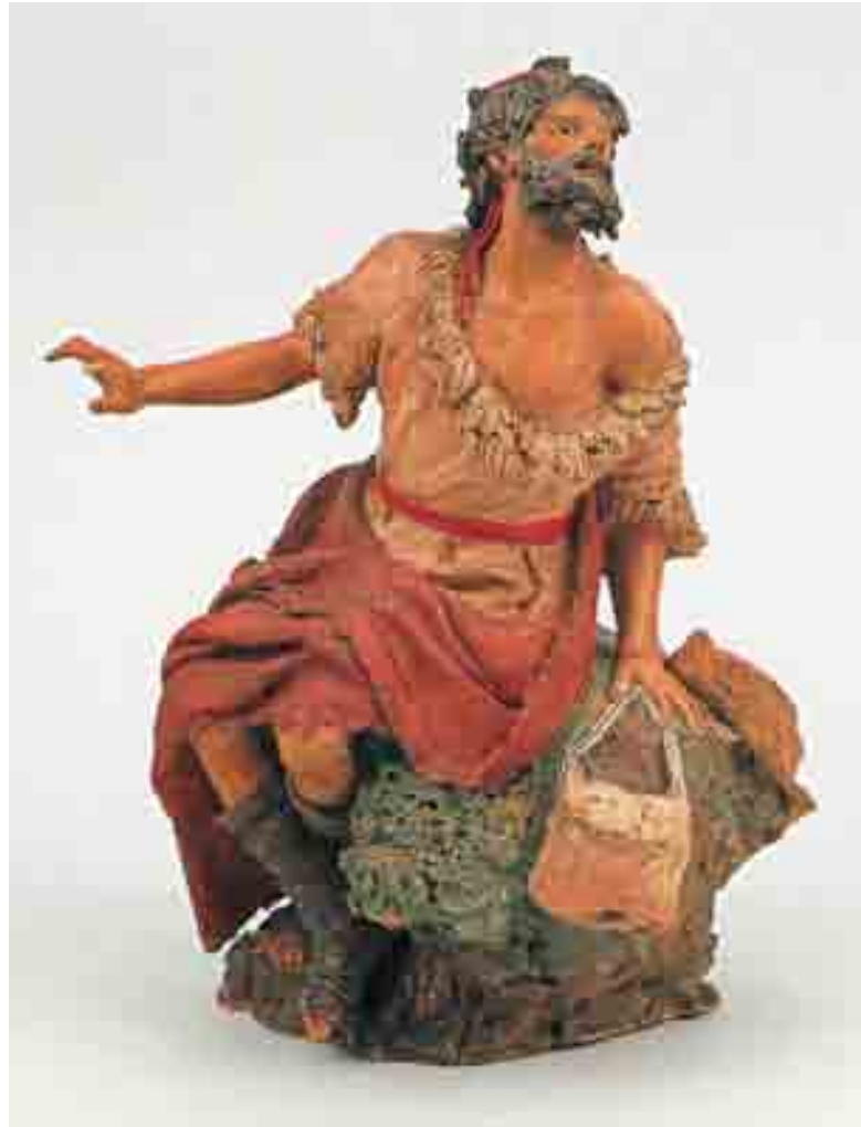
Pastor de l'Anunciata 27 x 16 x 14 Museu Etnològic de Barcelona