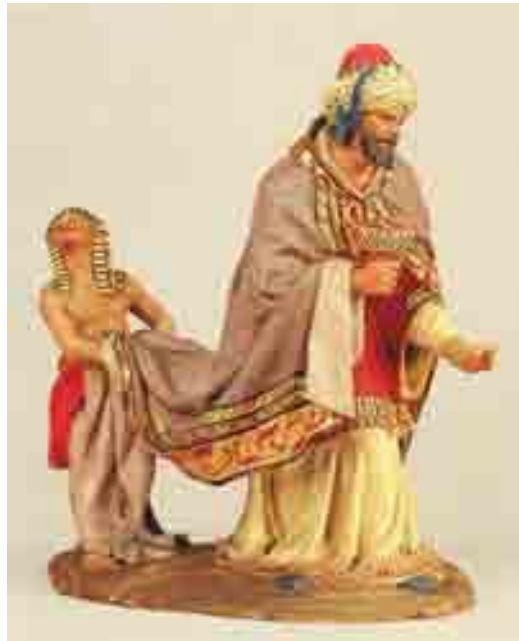
Rei Gaspar amb el seu patge 23.5 x 21 x 13 Museu Etnològic de Barcelona