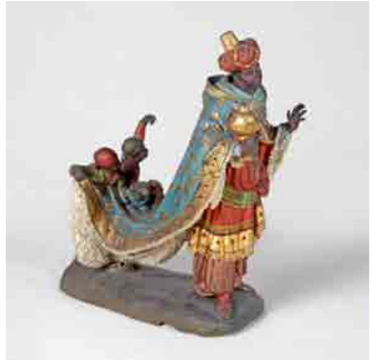
Rei Baltasar amb els patges