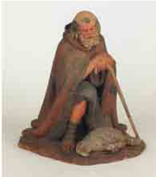
Pastor vell 16 x 16 x 13.5 Museu Etnològic de Barcelona