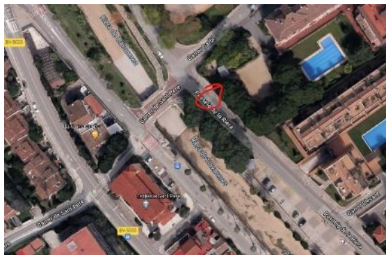
Localització del pas de vianants en qüestió

Resposta: Els tècnics proposen que una possible solució o mitigació seria resseguir la pintura vermella fins a aquest pas de vianants. De totes maneres, es preguntarà a l'enginyer si és pot repensar els punts de llum en aquest tram, ja que el fanal queda obstruït a causa de la vegetació.