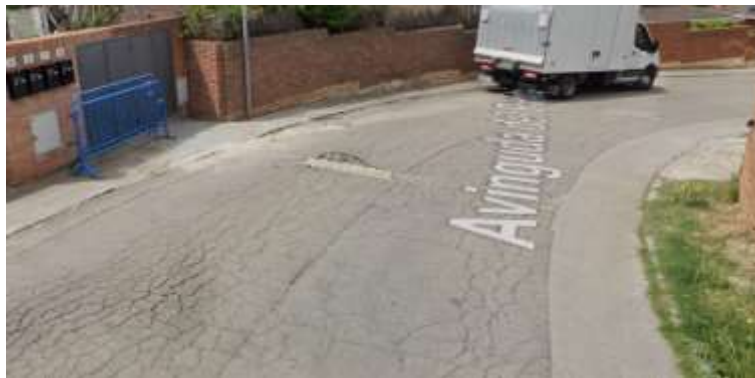
Estat del paviment a l'entrada de l'avinguda del Puntó.

No s'hi pot fer cap inversió pública perquè el servei no està recepcionat (és la mateixa casuística que s'ha indicat en la pregunta anterior).