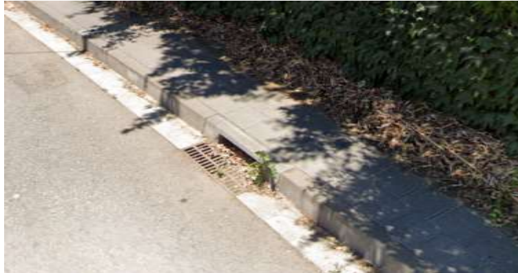
Embornal de recollida d'aigua al camí del Pla.

S'envia la petició als serveis de manteniment de la via pública per fer la neteja dels embornals, perquè puguin seguir fent la seva funció.