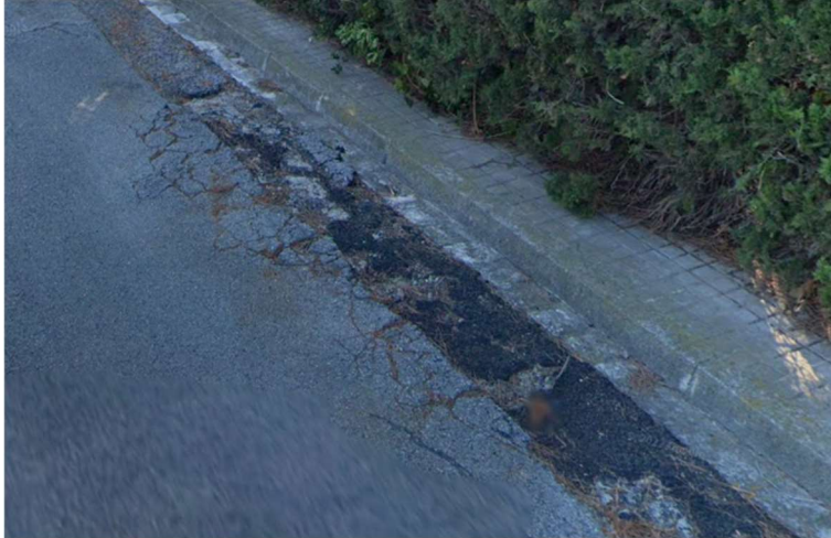
Asfalt del carrer de la Selva, 12

El regidor pren nota per traslladar les reclamacions als serveis tècnics municipals.