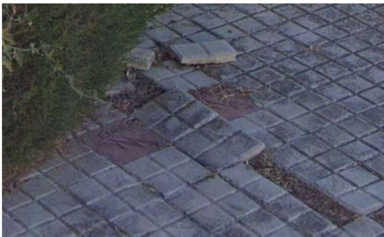
Asfalt del carrer Empordà, 21

El regidor pren nota per traslladar les reclamacions als serveis tècnics municipals.