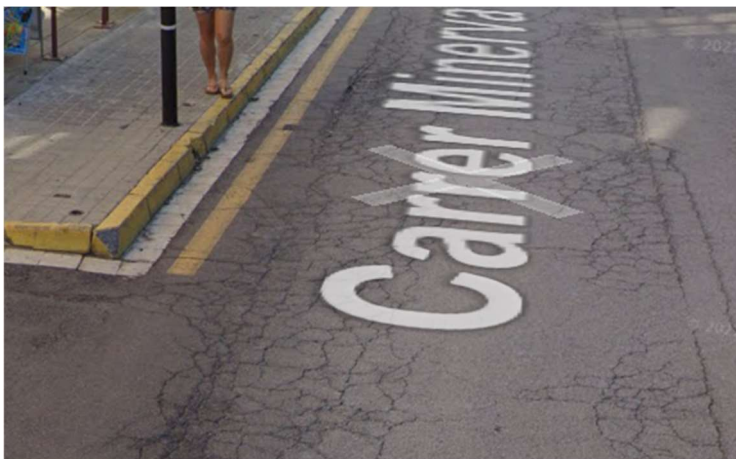
Carrer Minerva, 14

El Regidor informa que rep la reclamació i que la traslladarà a l'Alcalde, que és el responsable de mobilitat. Ambdues parts s'emplacen a una nova conversa telefònica, quan hi hagi més informació segura de quina actuació es pretén en l'esmentat carrer.