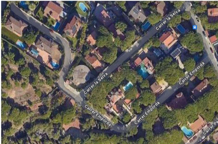
Situació del carrer de la Selva i el carrer Empordà

El regidor pren nota per traslladar les reclamacions als serveis tècnics municipals.