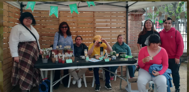
Participació del Casal del Pèsol a la Fira del Pèsol, celebrada el dissabte 11 d'abril al parc de Ca l'Alfaro

❖ El Casal del Pèsol és un servei públic de la Regidoria de Benestar Social de l'Ajuntament de Sant Andreu de Llavaneres, adreçat a joves amb diversitat funcional, tant intel·lectual com física, amb un cert grau d'autonomia.